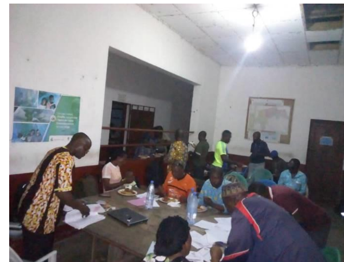
Paiement des frais de communication FOSA Avril, Mai, Juin