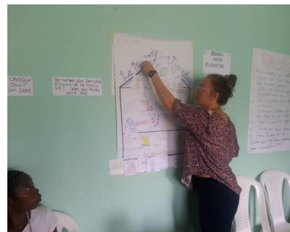
Entretien des PVVIH sur la nutrition