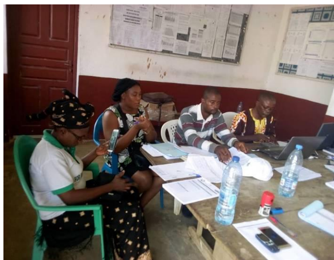
Présentation des objectifs de la réunion et de son intérêt