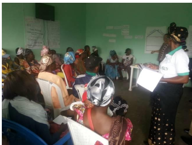
Groupe de soutien au CERJA