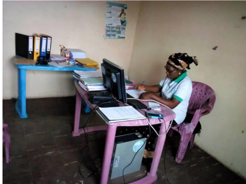
Prise de note sur l'utilisation du logiciel