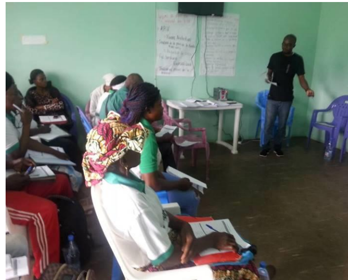
Présentation du projet aux participants par le superviseur