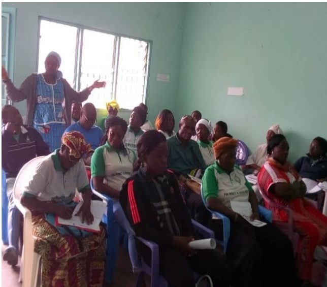
Témoignage de la responsable de l'OBC d'AKOM - BIKOE