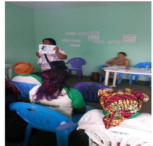
Prétest de la boîte à image par le chef du projet